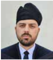
Írta: Kovács Csaba, lelkipásztor